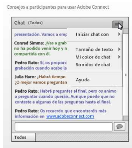
Ilustración 4. Chatear durante la presentación

Siempre podrá participar durante la presentación utilizando las opciones de la plataforma que se encuentran en la parte superior izquierda de la pantalla: