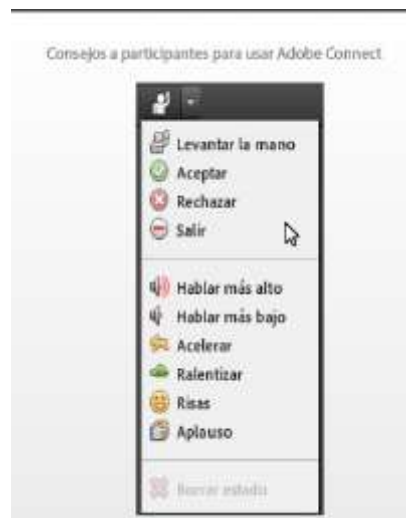
Ilustración 5. Interactuar con las herramientas de Adobe Connect

Si usted se perdió alguna parte del Webinar por cualquier razón, se mandará por correo electrónico una grabación audiovisual del taller al finalizarlo.